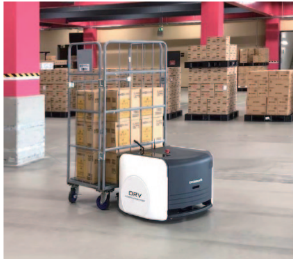
「ORV」の実証実験の様子