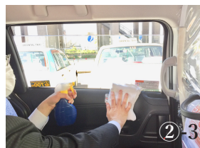
ドア内面・ガラス窓